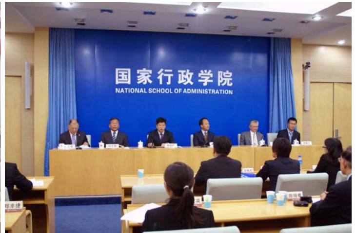
國家行政學院周文彰副院長、中聯辦副主任徐澤等主持澳門檢察官國情研修班結業典禮