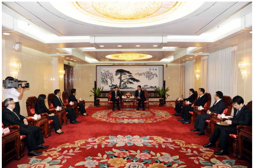
最高人民檢察院檢察長曹建明向澳門檢察官國情研修班學員介紹內地檢察機關的改革概況

8月26日，何超明檢察長率領研修班學員專程拜訪了最高人民檢察院，曹建明檢察長親自參加並主持了座談，會上首先由曹建明檢察長簡要介紹了最高人民檢察院的工作情況，最高人民檢察院檢委會專職委員童建明介紹了內地司法改革和檢察改革的規劃和成果。雙方一致認為，雖然兩地檢察機關制度不同，但面臨許多相同或相似的問題和挑戰，可以通過交流，相互學習和借鑒對方成功做法及有益經驗。雙方一致同意，可在適當的時候組織兩地檢察人員舉辦檢察工作專題研討。