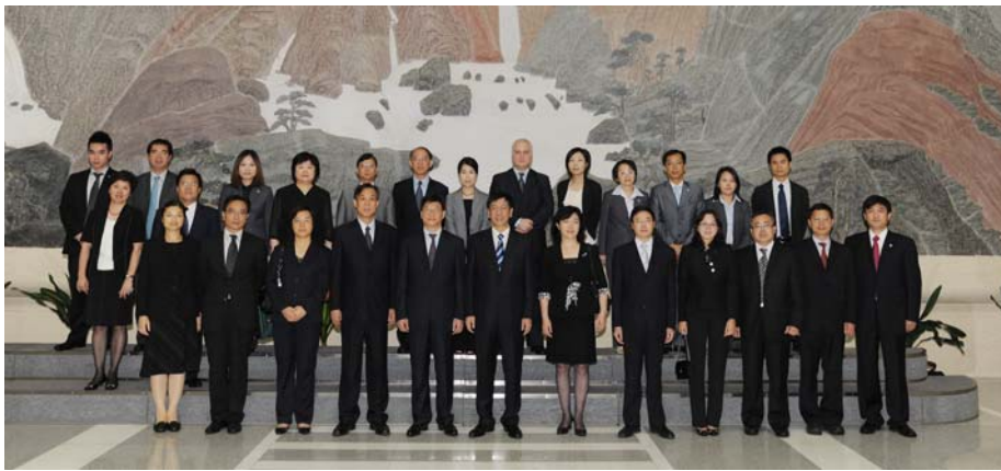
澳門檢察官國情研修班學員拜訪最高人民檢察院，並得到檢察長曹建明親自接見

其後，國務院港澳辦王光亞主任在釣魚臺國賓館接見並宴請何超明一行，王光亞主任高度贊揚了澳門一國兩制所取得的成績；肯定了檢察院作為特區管治架構的組成部分，在維護澳門繁榮穩定及法治建設上發揮了重要作用；高度評價了在檢察長領導下的澳門檢察院的同事們為維護特區繁榮穩定而做出的貢獻。席間雙方還就其他共同關心的問題交換了意見，並與學員們進行了親切的交談。