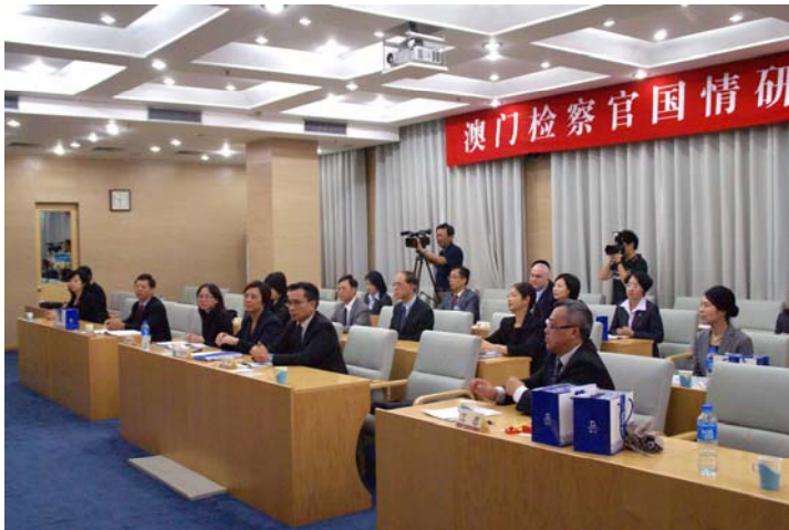
研修班學員在聽講座